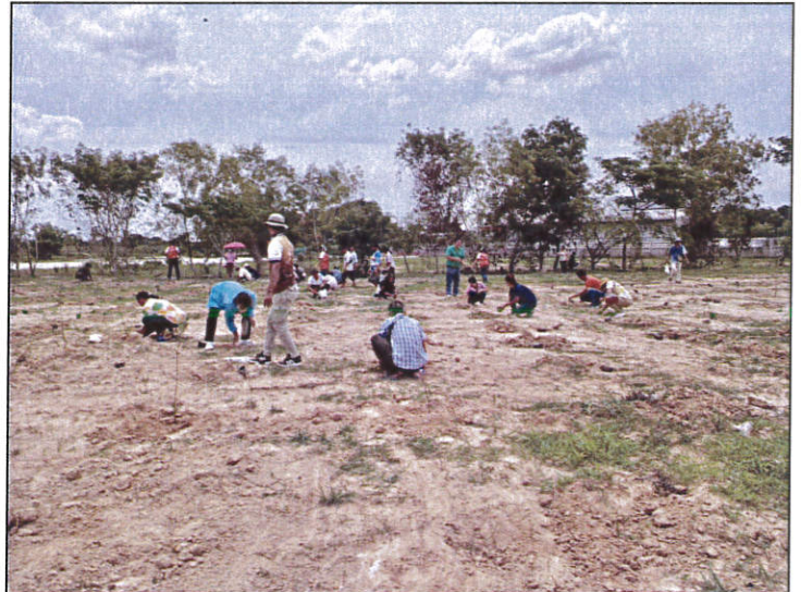
๒.กิจกรรมปลูกต้นไม้คนละ ๑ ต้น รอบบริเวณสนามกีฬาเทศบาลตำบลโคกจาน วันที่ ๖ มิถุนายน ๒๕๖๗