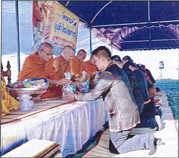
๑.โครงการนุ่งผ้าไทย ใส่บาตร ทุกวันศุกร์สุดท้ายของทุกเดือน

๘) การส่งเสริมให้เกิดความสามัคคีในองค์กร (Happy Society) การดูแล รักษาสิ่งแวดล้อมทางธรรมชาติและทางวัฒนธรรมของชุมชน